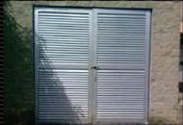
Puertas en lámina según diseño, formas y calibres, con pintura epóxica y esmalte de acabado ó pintura electrostática. Sistema de cerradura anti pánico para salidas de emergencia.