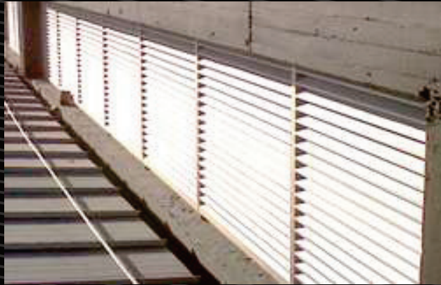
Persianas en lámina galvanizada, su diseño depende de las especificaciones del proyecto.