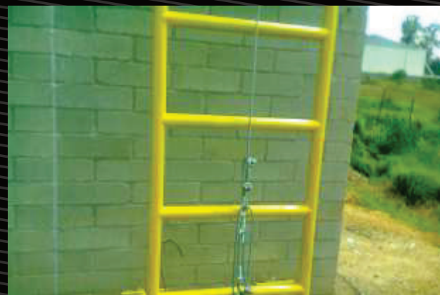
Este sistema comprende la construcción de escaleras metálicas más un sistema de línea de vida vertical, el cual garantiza la seguridad de las personas en el ascenso y descenso de la cubierta. Se pueden construir con y sin anillos de seguridad